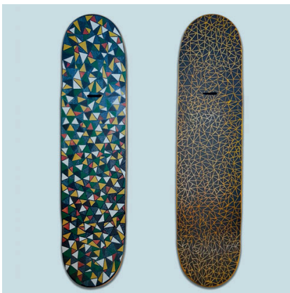
GLITCH - pochoir / grip art

Féru de skateboard, il dissèque, découpe, colle, assemble et recompose avec minutie et abnégation chaque planche, transformant l'objet roulant en objet d'art.