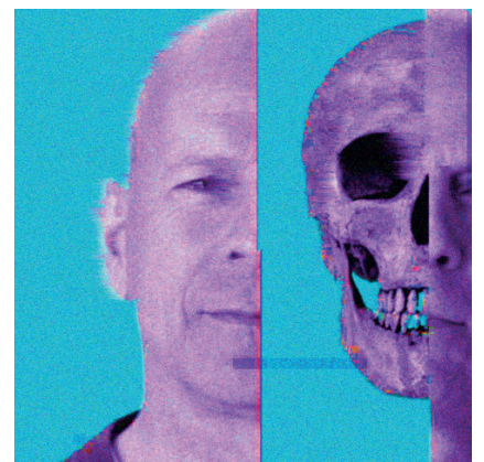
YBERO - graphisme / multimédia

Inspiré par les tags et la culture street, il mêle avec poésie ses talents calligraphiques à la peinture abstraite, donnant au graffiti une nouvelle vie hors les murs.